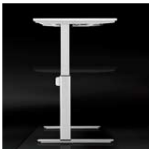
contec plus, Verstellbereich 68-118 cm

variabel. Die Abwechslung aus Sitzen und Stehen fördert einen gesunden Rücken und hilft Ermüdungsphasen am Arbeitsplatz schneller zu überwinden.