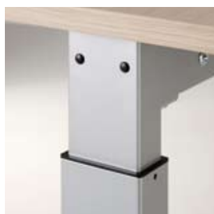
Sämtliche Gestellteile sind miteinander verschraubt und leicht austauschbar