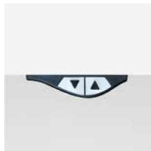
contec plus Steuerung elektrische Höhenverstellung