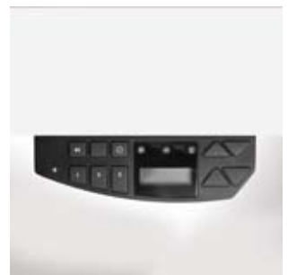
Optional contec plus Memory-Steuerung