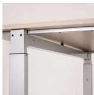
Ein Blick unter das Tischgestell lehrt, dass gutes Design mit der Konstruktion beginnt