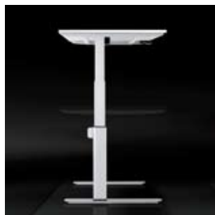
Optional: contec plus + mit Doppelhubsäule, Verstellbereich 65-130 cm